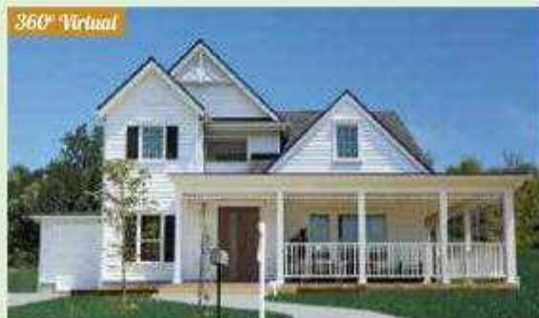
アーリーアメリカンスタイル