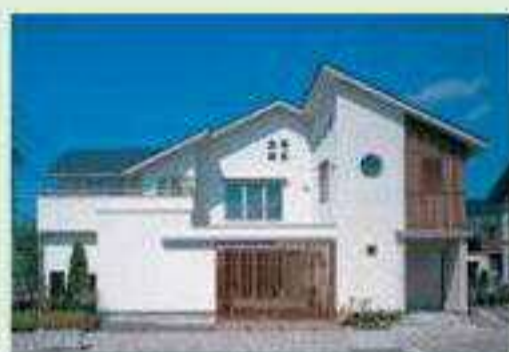
コンテンポラリースタイル