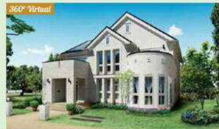
フレンチスタイル