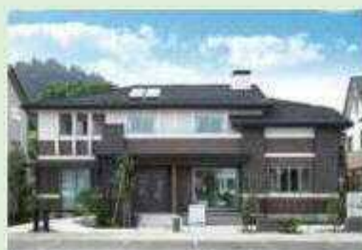
プレーリースタイル