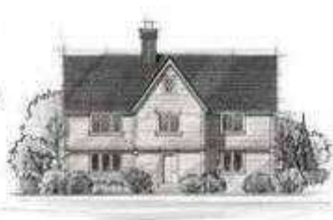
Early New England Colonial

北米生まれのツーバイフォー(2×4)建築は、欧米をはじめ世界のスタンダード工法として早くからその地位を確立していました。そして、明治時代に日本へ。それから100年以上経った今でも美しさを保っているのは、デザイン性のみならず、耐久性に優れた証なのです。 GLホームは1974年の2×4工法のオープン化以来、40数年に渡って伝統建築の良さを活かしつつ、現代の日本にぴったりの住品質にブラッシュアップした住まいをつくり続けてまいりました。 さらに今では、2×6工法に進化させ、より安心で快適な住まいをご提供しています。