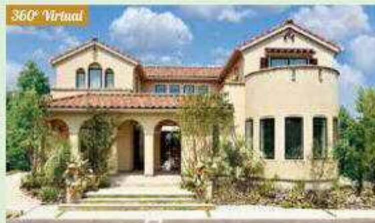
スパニッシュスタイル 中庭タイプ