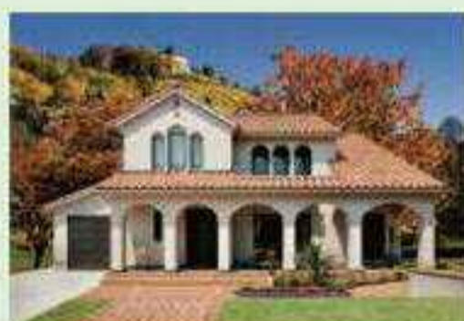
スパニッシュスタイル